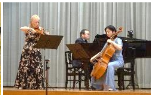
昨年度の合唱発表会・オータムコンサートより

10月21日(土)に令和5年度岡方中学校合唱発表会・オータムコンサートが行われます。今年度は体育祭同様に人数制限なしの対応となります。それに伴い、昨年行われた配信はありません。午後からのオータムコンサートは、岡方コミュニティーセンターからの補助を頂いての活動です。地域の方も遠慮なく生徒たちの歌声やプロの演奏を見に来ていただきたいと思います。ぜひ、お出てください。